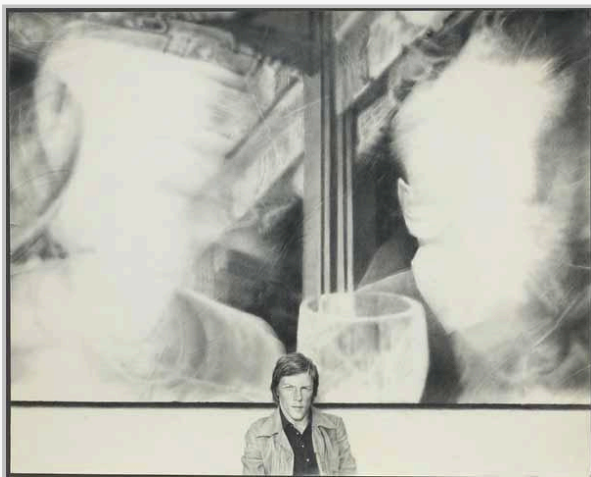
СЕРГЕЙ ГЕТА Автопортрет на фоне картины. 1984

В советской традиции гиперреализма темой картин зачастую становились заведомо «скучные», бытовые мотивы. Благодаря отстраненности в фиксировании предметов художники достигают «сверхобъективности» изображения, а искусство перестает давать оценку той реальности, которую создает.