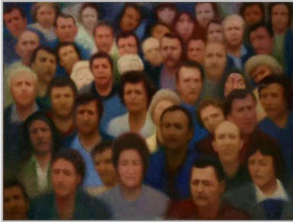
ПРАНАС ГРЮШИС Лицо. 1986