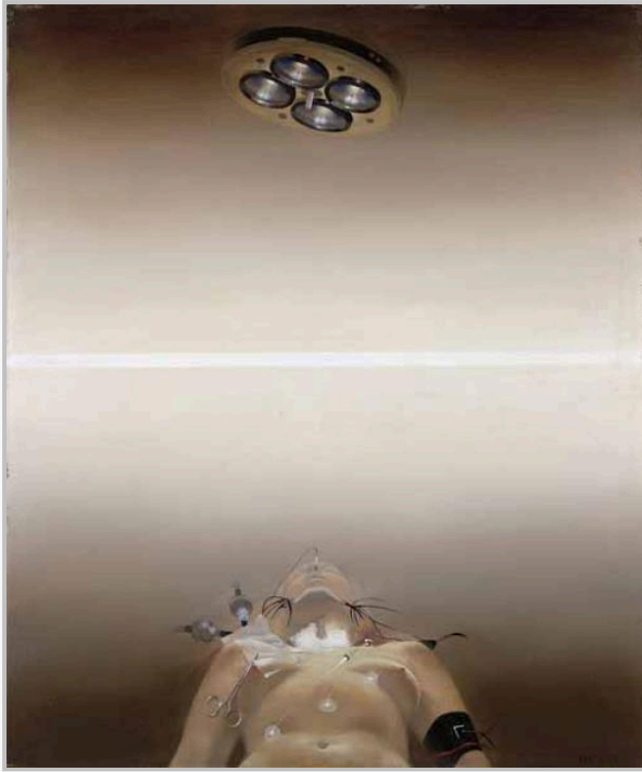
АНДРЕЙ ВОЛКОВ Операция. 1980