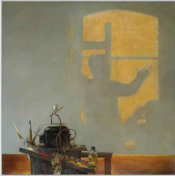
ГЕОРГИЙ КИЧИГИН Мастерская. Центральная часть. 1982