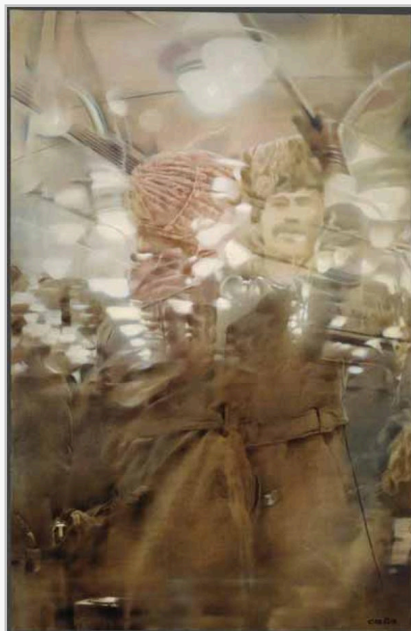
СЕМЁН ФАЙБИСОВИЧ Отражения. В соседнем вагоне. Из цикла «Московский метрополитен». 1985