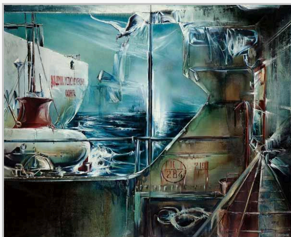
ЯАН ЭЛЬКЕН Научная экспедиция на Балтийском море. 1984

В экспозиции сформировано сложное пространство без прямых углов, его цель — обострить отношения между картиной и зрителем. Шесть разделов охватывают основные проблемные поля стиля: «Реальность — абстракция», «Холодная война», «Город», «Мастерская», «Вторая природа», «Я и другие». Картины дополнены образцами «слайд-культуры» (слайды — исходники для живописных произведений, слайд-фильмы); мультипликационными фильмами, в эстетике которых сплавлены гиперреализм и поп-арт; фотографическими опытами художников.