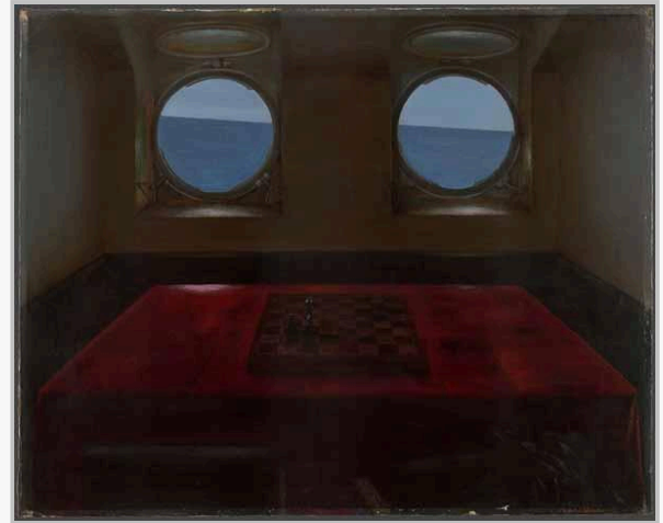
АНДРЕЙ ВОЛКОВ На пограничном корабле. 1977