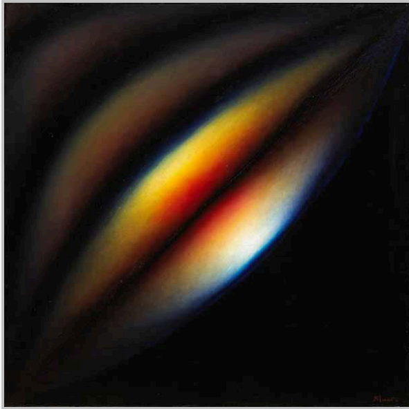
ЭРИК БУЛАТОВ Разрез. 1965–1966