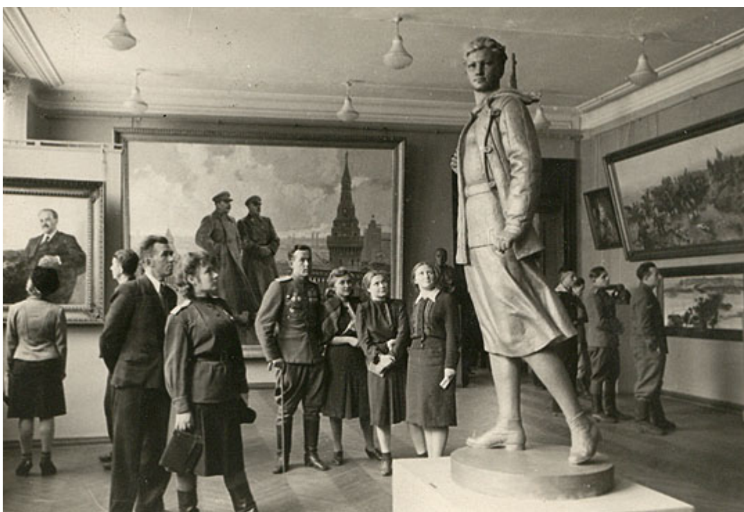
Зал советского искусства. 1945

Серьезная исследовательская работа продолжалась и в изучении творчества живописцев XVIII – первой половины XIX веков. Настоящим открытием для публики и научного сообщества стали выставки «Портрет петровского времени» (1973, совместно с Государственным Русским музеем) и «Неизвестные и забытые портретисты XVIII – начала XIX веков» (1975). В 1971–1972 годах к 100-летию Товарищества передвижных художественных выставок были созданы экспозиции «Первая выставка Товарищества передвижных художественных выставок 1871–1872 годов. Реконструкция», «Передвижники в Государственной Третьяковской галерее» и др.